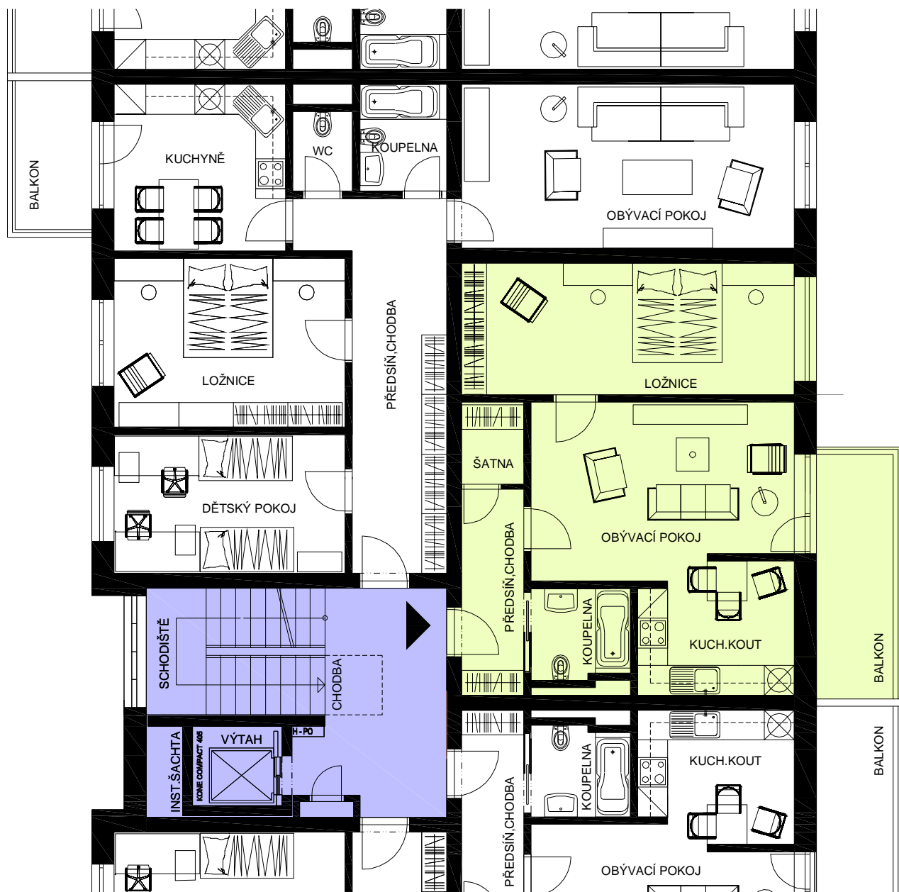
BYT 2+KK M2