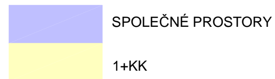
SCHEMA UMÍSTĚNÍ BYTU